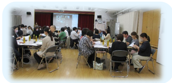
令和6年度地域懇談会