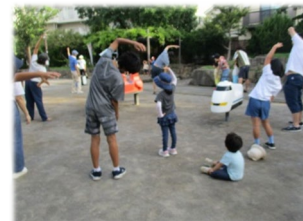
みんなで食卓を囲みます 夏のおやつはかき氷！