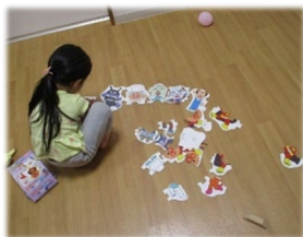
タワーやカード遊び、一緒にあそぼう！！

ショートステイは、親御さんの病気やお仕事、その他の理由により、子育てが一時的に困難になった場合に短期間にお子様をお預かりすることで、ご家庭での子育てをサポートします。