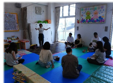
助産師さんの抱っこ講座

季節の行事として「子どもの日」「七夕」「水遊び」を開催。福音寮の保育園と連携した保健や食育についてのお話会や離乳食試食会ではお悩み相談や質問が次々に出るなど関心の高さがうかがえました。